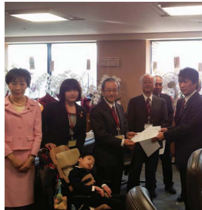
▲2013年2月4日、田村厚生労働大臣に要望書を提出(項目は右記)